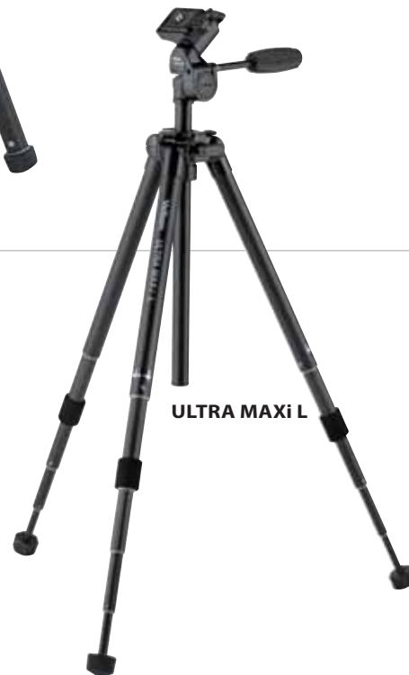
ULTRA MAXi L