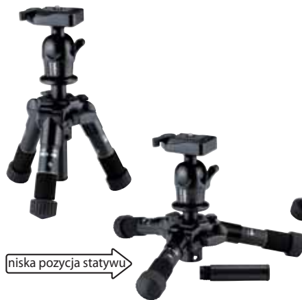
ULTRA MAXi mini