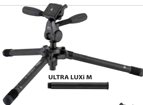
ULTRA LUXi M