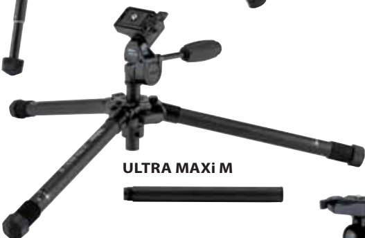
ULTRA MAXi M