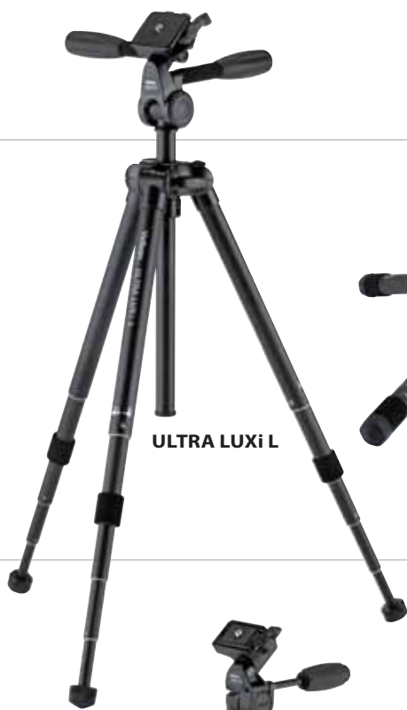
ULTRA LUXi L